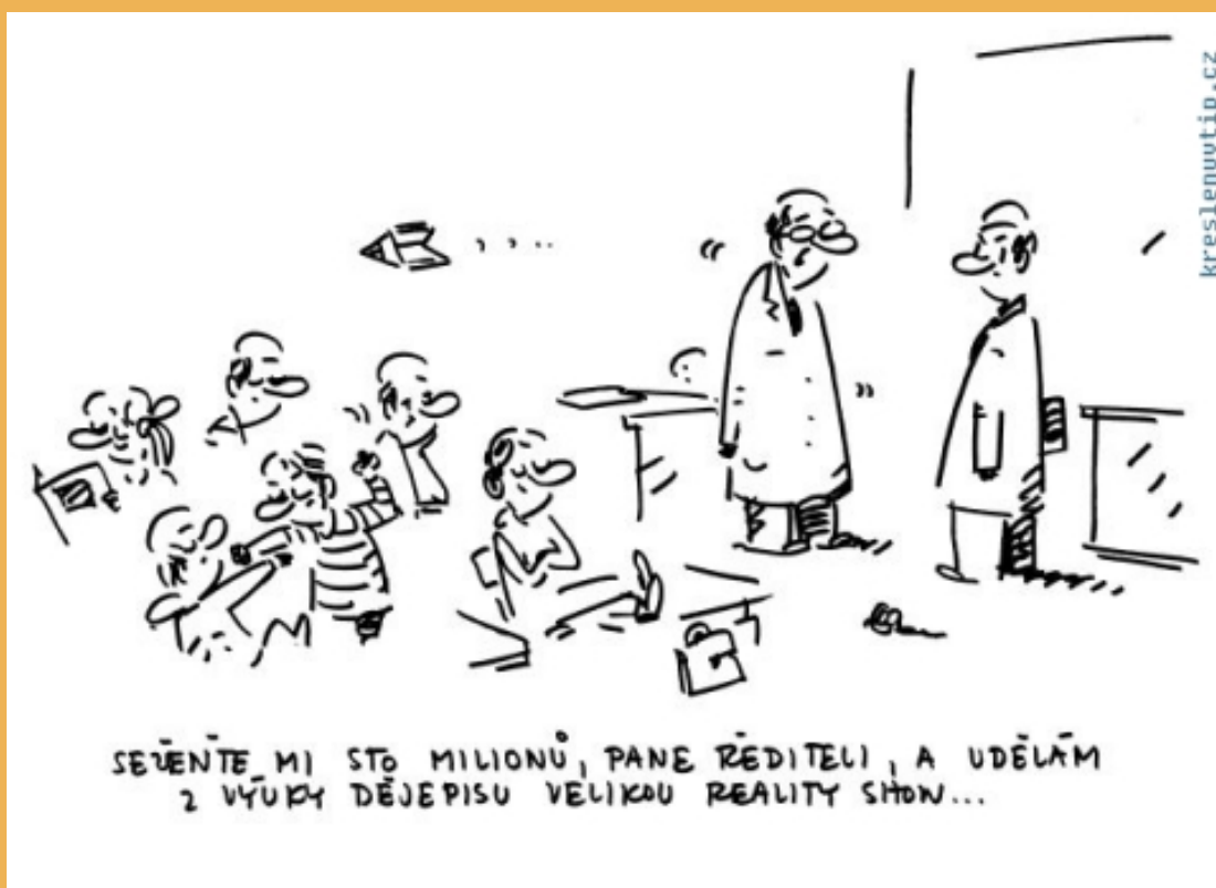
Ilustrace: Miroslav Kemeř